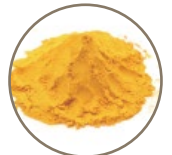
ウコン 創傷治癒作用