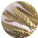
コムギ胚芽油 抗酸化作用