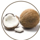
ヤシ油 免疫力向上