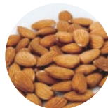
アーモンド油 保湿作用