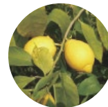
レモン果皮油 抗菌作用